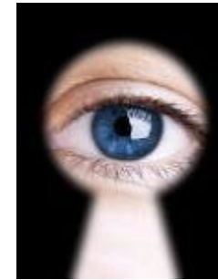
Akkreditierung & Zertifizierung